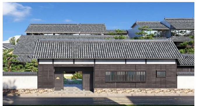
マンダリン オリエンタル 瀬戸内－直島